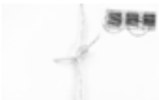
Titel: To whom it may concern (AP, op dibond, oplage 1/10 € 300,-) 'Wanneer je je aangesproken voelt hoor ik het wel!'