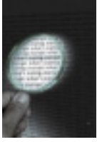
Titel: What's eating Europe (AP, op dibond, oplage 1/10 € 400) Selected 'Europe summer exposition 2019', museum De Fundatie.

'Het thema Europa trekt mij aan. Dit grote avontuur dat soms een kortstondig leven lijkt beschoren door incompetentie van enkele deelnemende landen. Toen ik de zin 'What's eating Europe' had verzonnen wist ik dat het een spannende foto moest worden. Die sfeer van een privé-detectieve-achtige scene was een goede ingeving.'